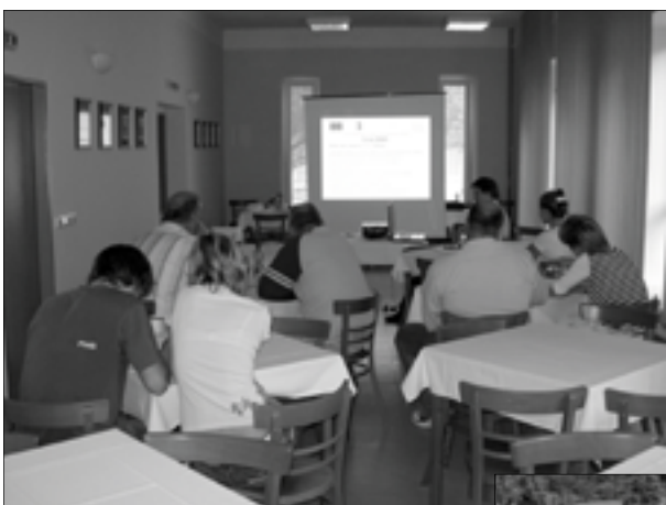
První školení pro žadatele o dotaci v 1. výzvě MAS Šumperský venkov

Bližší informace můžete získat na internetových stránkách www.sumperskyvenkov.cz a Vaše případné záměry konzultovat s pracovníky MAS na Obecním úřadu v Novém Malíně. Neváhejte a využijte jedinečné možnosti získat dotaci EU právě pro Váš projekt !