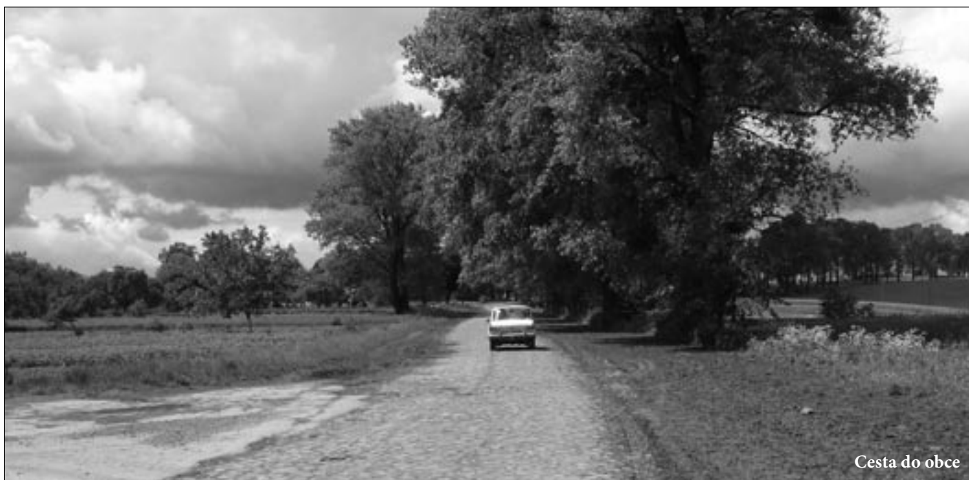
Cesta do obce