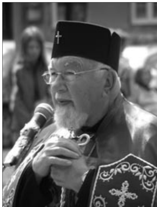
Květen 2009 v Novém Malíně