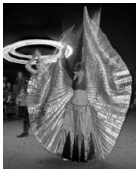
Vpravo: Ohnivá show