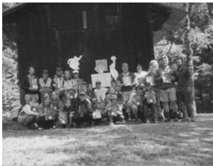
Záběry ze soustředění oddílu