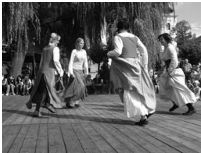
Perchty von Bladen