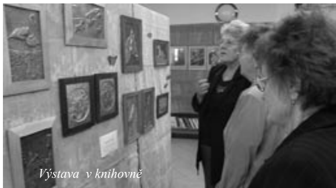
Výstava v knihovně