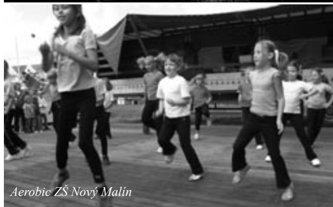
Aerobic ZŠ Nový Malín