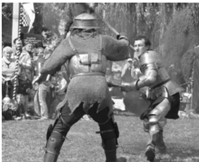
Vlevo: Šermíři z Bludova