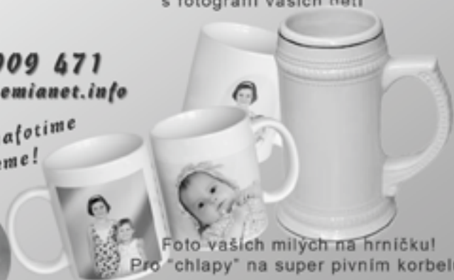
Foto vašich milých na hrníčku! Pro "chlapy" na super pivním korbetu!

Přejeme všem našim zákazníkům radostné a veselé vánoce a šťastný rok 2010!