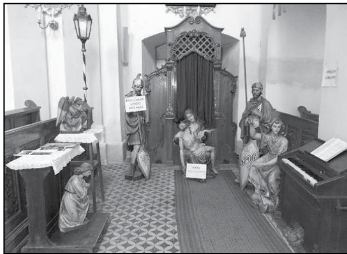
Noc kostelů - výstava soch z depozitáře kostela

Svátek Narození Panny Marie patří k nejstarším mariánským svátkům. Skutečný den jejího narození neznáme. Od 5. století se v Jeruzalémě slavil 8. září. Byl to výroční den posvěcení baziliky postavené na místě, které tamní tradice označovala za místo, kde se Maria narodila. Od 7. století se tento svátek slavil všeobecně.