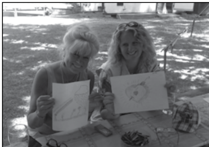
Nejen dětský den

v Šumperku. Mimo to se výjezdová jednotka zúčastnila taktických cvičení na únik čpavku na zimním stadionu v Šumperku a dálkové dopravy vody v katastru obce Petrov nad Desnou, kde se společně s dalšími osmi jednotkami podílela na tvorbě hadicového vedení od řeky Desné, až na vrchol Granátové hory. V březnu absolvovali členové jednotky, kteří jsou nositeli dýchací techniky, výcvik s dýchací technikou na Robotárně v Šumperku, který byl zaměřen na vyhledávání osob v zakouřeném prostředí.