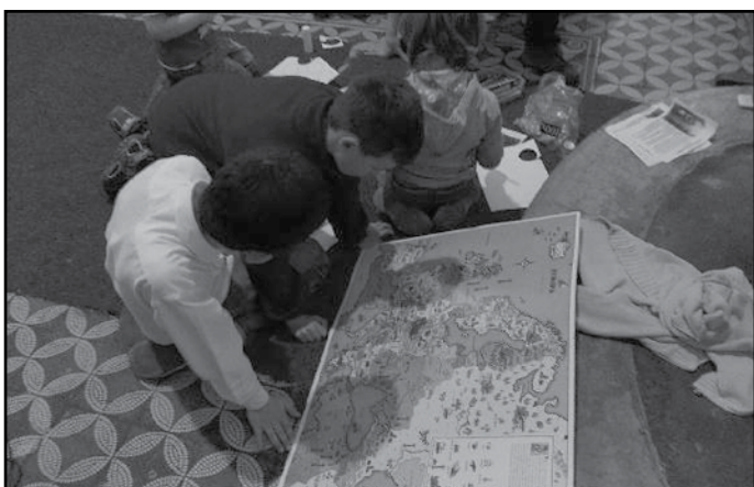
Hledání na mapě – „Obrazy a sochy v kostele“