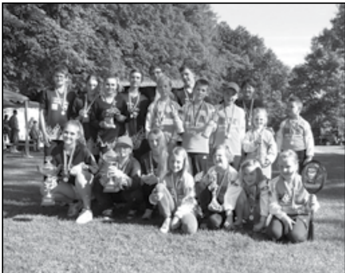
Finále ligy MH - celkové vyhodnocení