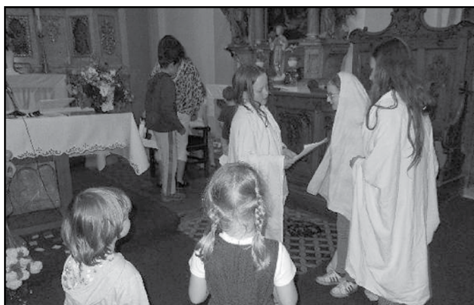
Zastavení u sv. Cyrila a Metoděje