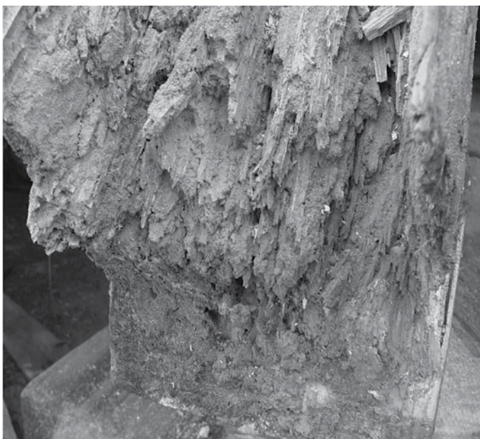
fotografie poškozeného krovu