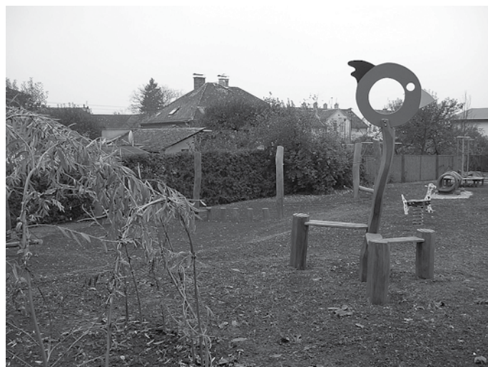
Horní MŠ č.p. 303