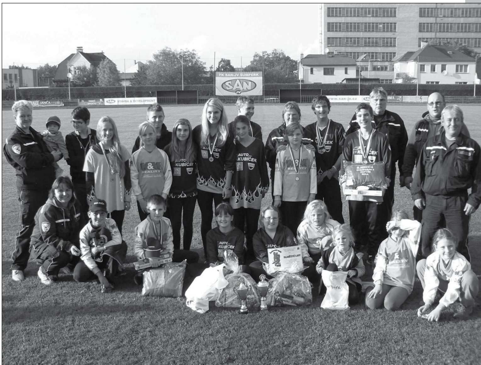
Šumperský Soptík 2014