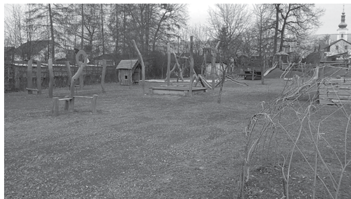
Dolní MŠ č.p. 503