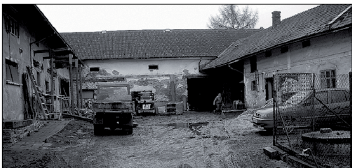
Nahore: Před realizací, dole - po realizaci