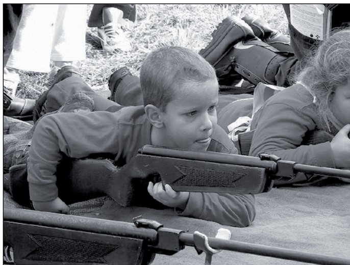
ZPV Lesnice - ti nejmenší na střelbě