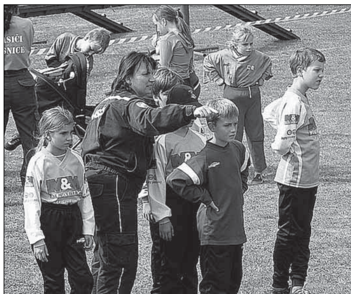
Trojboj Svěbohov - poslední pokyny...