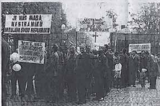
VÝJIMEČNÝ 1. MÁJ. Zaměstnanci šumperských Železničních dílen vyšli v roce 1968 s odvážnými transparenty.

„My jsme stále s kamarády řekli, že půjdeme. Jenom budeme slavit po svém,“ posal Diviš. V šumperské hospodě Na Benátkách vymýšleli transparenty kterými by průvod oživil. Už předtím ale řadu měsíců pravidelně informovali zaměstnanci o pražských pokasech reformo-