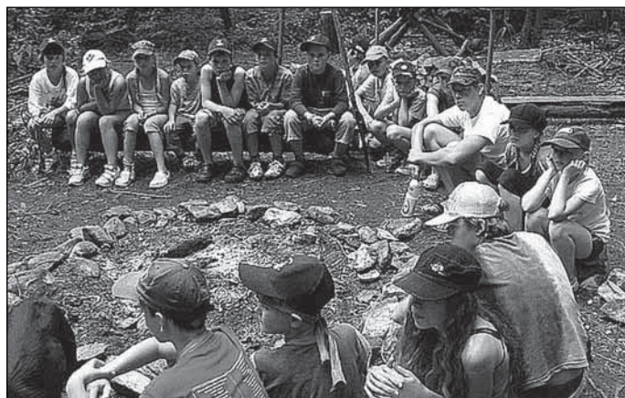
Tábor MH Prudký potok