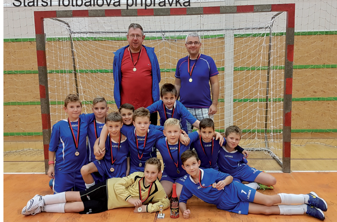
Starší fotbalová příprava

do detailu, protože si myslíme, že nejdůležitější je fakt, že všichni hráči dostali dost příležitostí zahrát si fotbal a sbírat fotbalové zkušenosti.