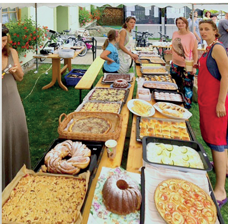
Porota a její slib: