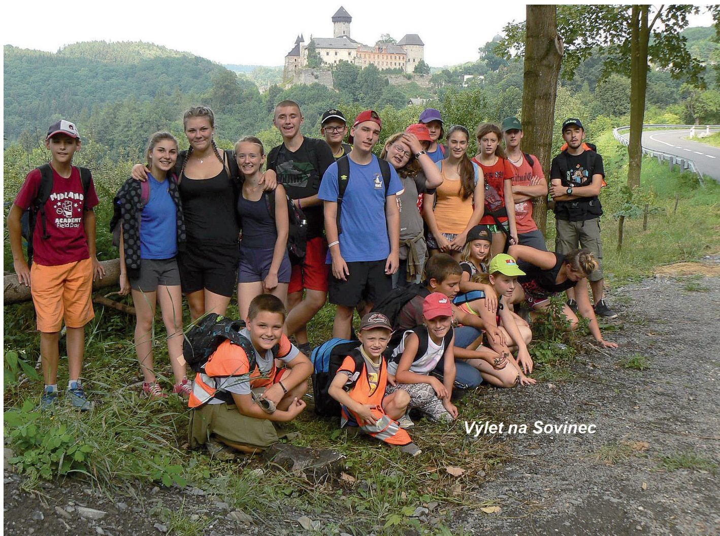
Výlet na Sovinec

Po letech minulých, kdy naše družstvo mužů objíždělo opravdu každou soutěž Velké ceny okresu Šumperk a družstvo se doslova lepilo ze dne na den, aby mohlo startovat, jsme se letos