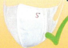
NANOFIBER MASK RESPIMASK