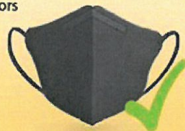
NANOFIBER MASK RESIPRO CARBON