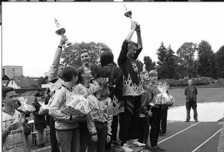
Starší celkovými vítězi ve družstvech