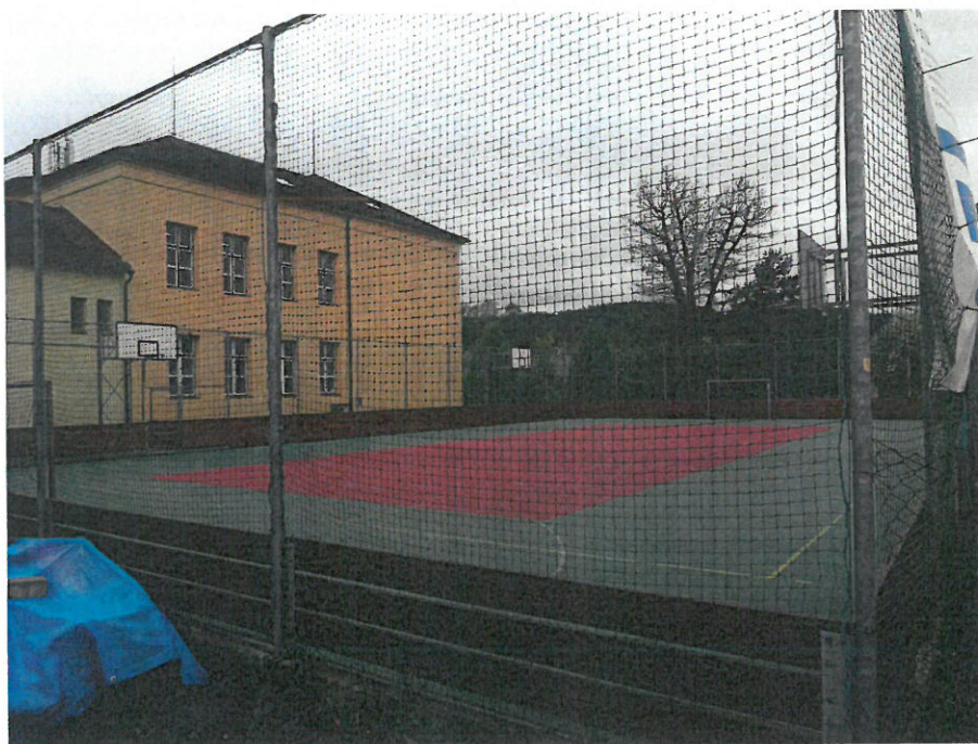
Hřiště u základní školy