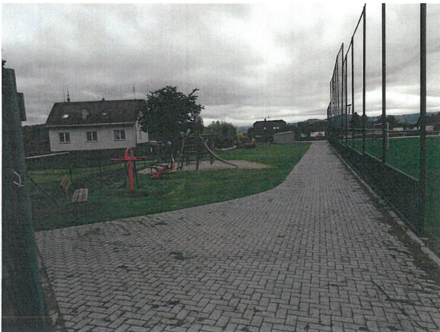
Dětské hřiště u sokolovny