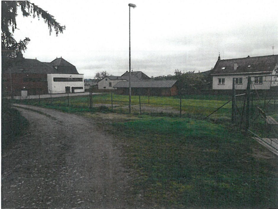
Hřiště u sokolovny