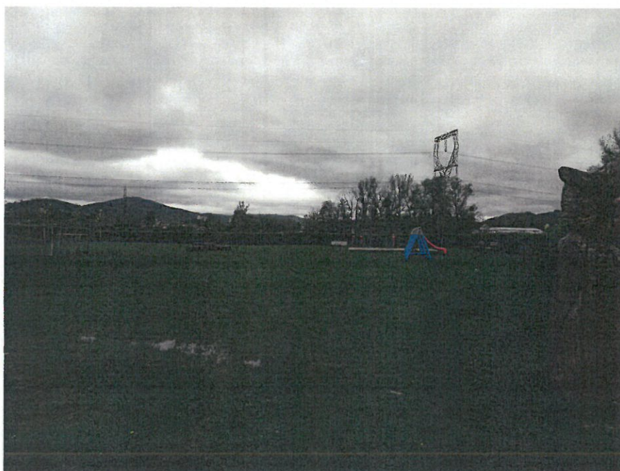
Dětské hřiště „Luže“