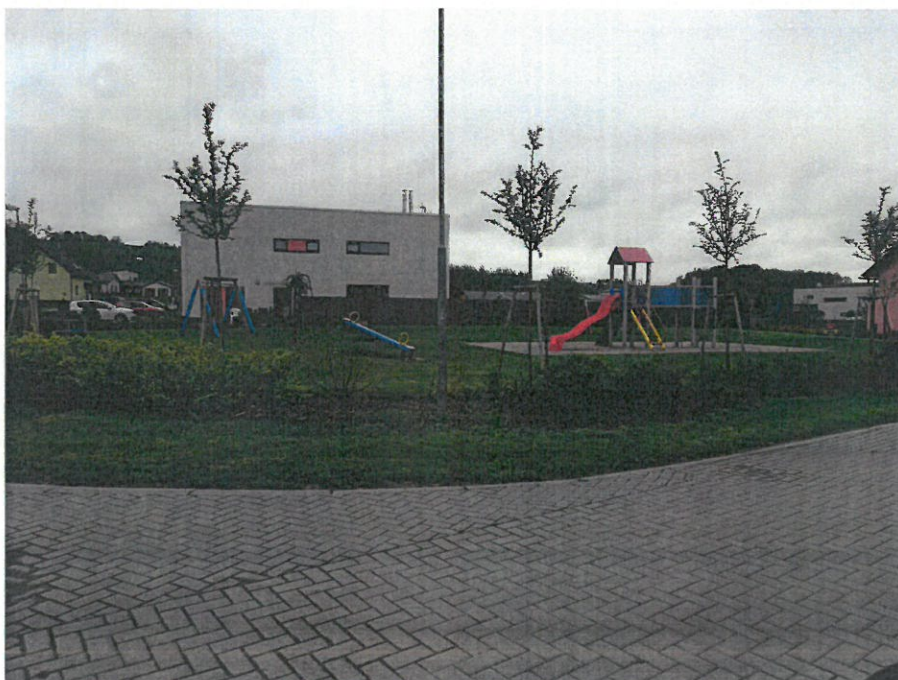
Dětské hřiště „U Poldru“