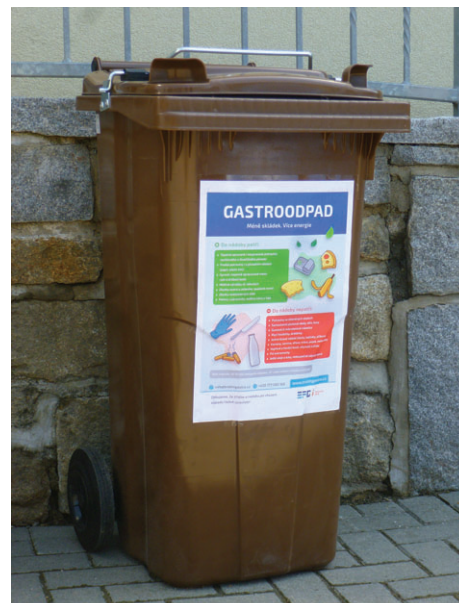
nádoba na gastroodpad