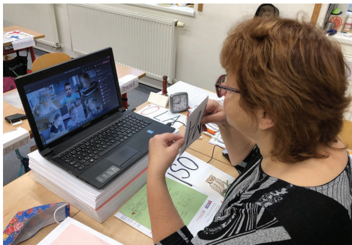
Vyuka Microsoft Teams

Distanční či chcete-li vzdálená výuka je od září 2020 zakotvena i ve školském zákoně. Žáci se jí tedy musí zúčastnit, rodiče omlouvají případnou absenci. Povinností školy je ale zároveň zohledňovat materiální, sociální a další podmínky jednotlivců, které mohou mít vliv na jejich vzdělávání. V malínské škole využíváme školní systém EduPage (informace, zadávání práce, testování, známkování apod.) a zejména pro videokonferenční výuku aplikaci Microsoft Teams. Činnost je to náročná, ale dovolím si říci, že většina zúčastněných se snaží i tímto způsobem vše zvládnout. Distanční výuka nemůže zcela nahradit pobyt ve škole, ale pomocí ní jde aspoň zmírnit negativní dopad na vzdělávání, všem již, bohužel, dobře známé nemoci.