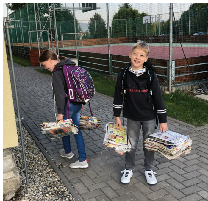
Přines co uneseš

Během roku se škola rovněž zapojila do charitativních akcí a to v rámci sbírky Českého dne proti rakovině (známá žlutá kytička) a lednové Tříkrálové sbírky. Jak naše žákyně a žáci chápou potřebu chovat se a myslet v souladu s přírodou, ukázali při podzimní sběrové akci, tentokrát nazvané jednoduše Přines, co uneseš. A že sílu mají, dokazuje 1 121,5 kg starého papíru 😊.