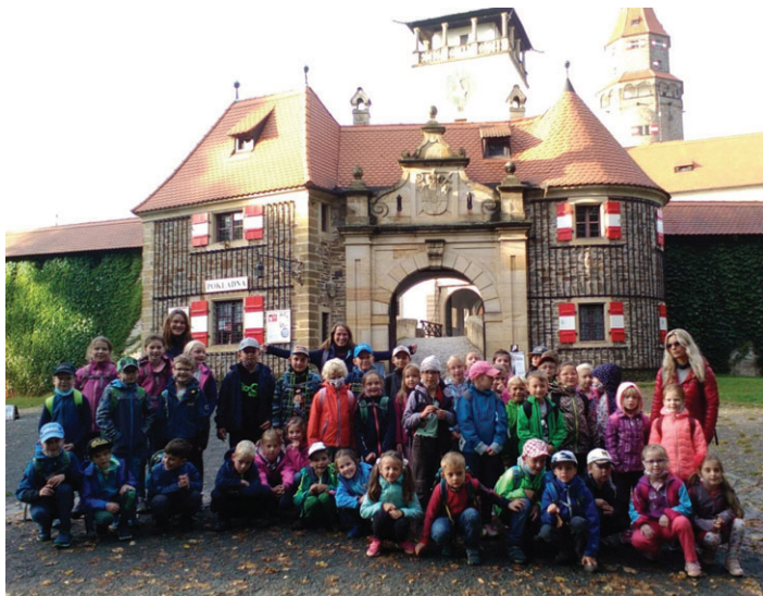
Školní družina na Bouzově

lektorů ÚEV Mladoňov. V rámci tzv. školního preventivního programu proběhly v sedmých a osmých třídách besedy na téma Jak přežít s rodiči, Rizika v kyberprostoru, Skrytá nebezpečí internetu a Moc slov. Sympatickým zpestřením pak byly workshopy, kdy žáci anglicky konverzovali s rodilými mluvčími.