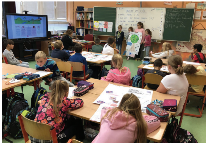
Projektový den o ČR

I přes omezený pobyt ve škole se nám podařilo uskutečnit řadu zajímavých akcí. Během zářijového třídního pobytu na Švagrově veveřčák František seznámil třetáčky s taji podzimní přírody, čtvrtáci se učili spolupracovat během projektového dne o ČR, pátáci zakotvili na chatě Barborka a zkoumali krásy Jeseníků, žáci 2. ročníku vyjeli na Černý Potok a prožili si „Příběh hraček“. V rámci školní družiny se 46 dětí „vybálo“ při strašidelné návštěvě večerního hradu Bouzova a v říjnu se ještě V.A pokusila přežít v lese pod vedením