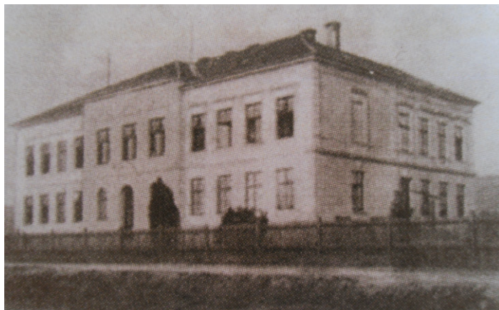
foto 4 - dnešní základní škola