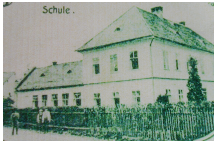
foto 3 - budova dnešního obecního úřadu