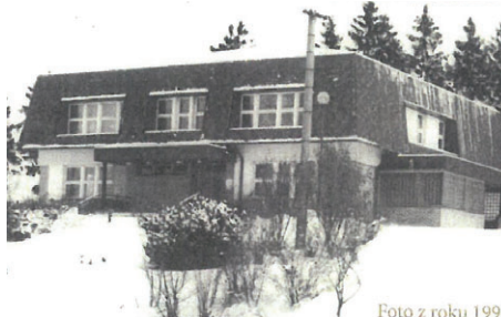
Foto z roku 1995