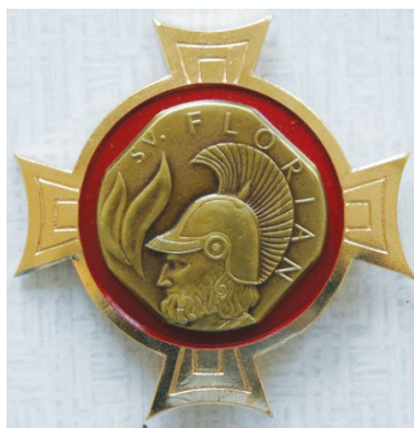
Řád sv. Floriána