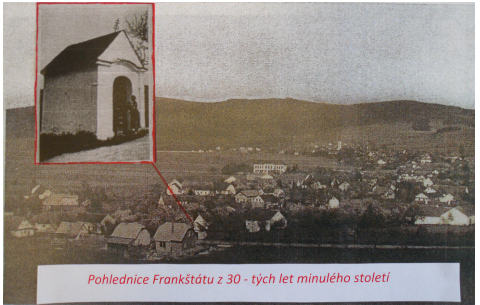
Pohlednice Frankštátu z 30 - tých let minulého století