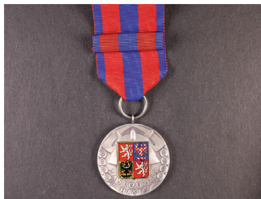
titul zasloužilý hasič

9. dubna upořádala obec dětský maškarní ples a večerní zábavu s kapelou reLucie, kde náš sbor zajišťoval občerstvení a volba langošů, jako jednoho z jídel, byl dobrý tah. Dětský ples navštívilo velké množství masek i rodičů, ale večerní zábava byla slabší. Někteří občané nám sdělili, že na plakátě byl zvýrazněn spíše dětský den, než večerní zábava, ale i já jsem slyšel náš místní rozhlas aspoň třikrát hlásit jak dětský ples, tak zábavu, proto si myslím, že když se polepší v informovanosti pořadatelé a občané budou více poslouchat, budeme spokojeni všichni.